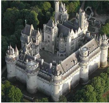
Castillo de Pierrefonds, Francia

Los castillos construidos bajo una rigurosa concepción geométrica y una notable sobriedad, difieren del afán pintoresco del romanticismo.