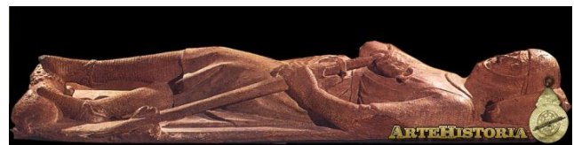
Estatua yacente de un caballero, Iglesia San Juan Bautista De Danbury en Inglaterra

Alemania recibió un estilo ya formado, en contradicción con la errónea creencia de su autoría, el gótico se extendió por toda Europa, Inglaterra y el oriente latino, donde se fue paulatinamente extinguiendo, dando pasos a nuevos estilos.