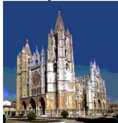
Catedral de Burgos, Una de las máximas realizaciones del gótico hispano

A pesar de la resistencia por adoptar el estilo, Italia representa las características del gótico en formas accesorias. El único templo enteramente gótico en la catedral de Milán, monumental construcción concluida sólo hasta entrado el siglo XIX.