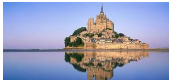
Mont-Saint-Michael. Islote normando

El arte de estilo gótico se remonta a la época medieval, allí abundaban los recintos monásticos claustros , capillas, basílicas e iglesias, donde el trabajo de los arquitectos se sucedía uno tras otro, respetando la ejecución del plano original.