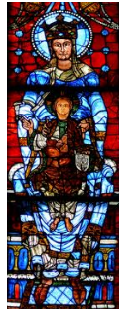
Notre.Dame a la Belle Verriere, Vitral de Chartre

El vitral es considerado como la auténtica pintura románica francesa. El color adquiere vitalidad gracias a la luz que atraviesa los ventanales al interior de las catedrales .