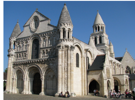
Notre-Dame la Grande de Poitiers, 1143

En el arte Románico, se pretende que la escultura, la pintura y la arquitectura sean una sola. En esta época las construcciones predominantes fueron las iglesias y monasterios , con columnas adornadas en sus capiteles por relieves de figuras humanas, animales o motivos decorados con hojas y muros repletos de pinturas al fresco , vidrieras y vitrales .