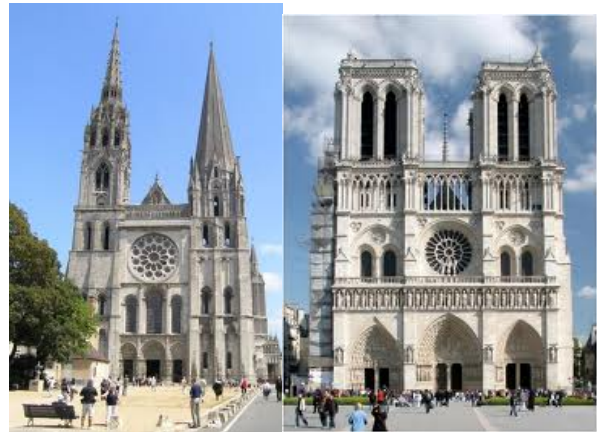
Catedral de Chartres, la más clásica del gótico francés Catedral de Notre Dame Paris (1200-1240)

El carácter esencial de la construcción gótica está en el empleo de un tipo especial de bóveda en ojiva, reconocido como estilo ojival.