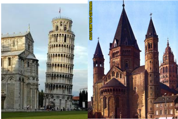
Catedral de Pisa y campanario o Torre inclinada. (Debe su inclinación al movimiento del terreo en que se asienta) Catedral de Maguncia. Románico alemán.

La arquitectura suntuosa , influenciada por alemanes lombardos , representada en la construcción de catedrales y basílicas , presenta una amplia variedad de estilos combinados, en las cuales se puede apreciar el empleo de columnatas griegas, adornos de origen mesopotámico, arcos romanos y la decoración interna compuesta de mosaicos y frescos alusivos a temas religiosos políticos.