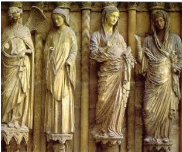
Figuras esculpidas en la fachada de la Catedral de Reims.

La escultura gótica (finales del siglo XIII) en el norte de Francia se caracterizó por la búsqueda del naturalismo y la humanización del mundo divino. Está totalmente subordinada a la arquitectura y es creada prácticamente en función de ella.