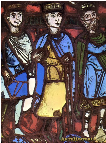
"Los reyes magos" Vital de Saint Denis, Siglo XII

Los orígenes del arte románico y del periodo medieval se remontan al año 500 a. C., bajo el dominio de los pueblos celtas , representado en la expresión de grafismos y simbolismo abstracto. Con el surgimiento de nuevos pueblos nómadas de origen asiático se establece el tipo de arte completamente medieval conocido como arte Bárbaro.