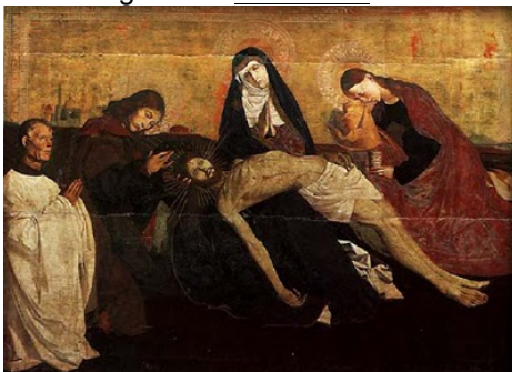
la piedad de Villeneuve-les-Avignon. Museo de Louvre. Siglo XV.

La pintura en cambio, se remite en su mayoría a vitrales, códices y retablos en su etapa inicial, posteriormente las miniaturas y vidrieras y a finales del siglo XIV surge el “Estilo Gótico Internacional” cuyas principales características son el colorido, su fuerte naturalismo, la tendencia caricaturesca y la aparición de la figura del mecenas .