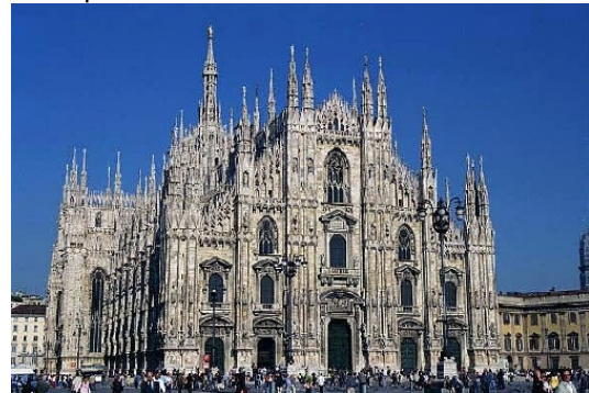
catedral de Milán Único templo italiano enteramente gótico.

El gótico español fue en todo el resto de Europa, de importación francesa, asimilando con fidelidad los parámetros básicos para la preservación del estilo en todo su esplendor.